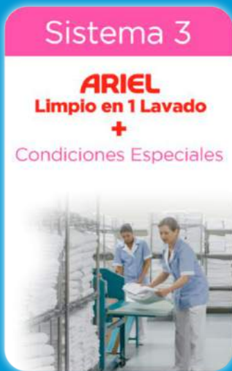
RESULTADOS ARIEL EN SISTEMAS ALCALINOS